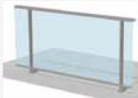
Remplissage verre sous main courante