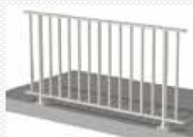
Barreaudage sous main courante