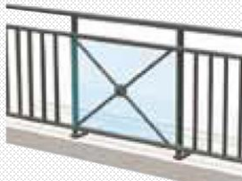
Bande filante sous lisse avec barreaudage et croix de Saint-André