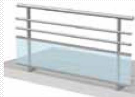
Bande filante version «paquebot»