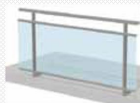
Bande filante sous lisse avec remplissage verre